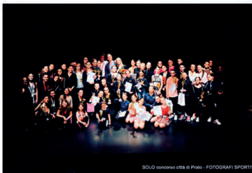
SOLO concorso città di Prato - FOTOGRAFI SPORTIVI