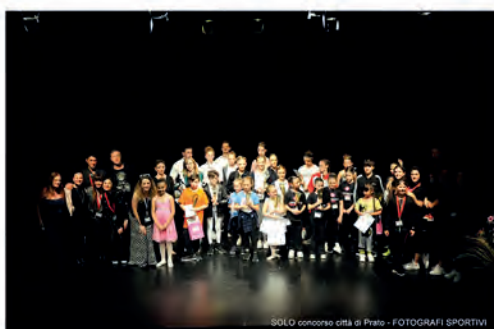
SOLO concorso città di Prato - FOTOGRAFI SPORTIVI