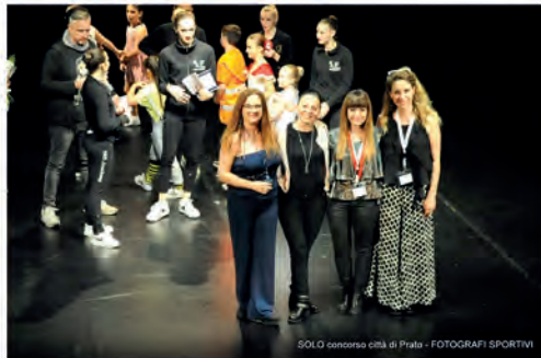
SOLO concorso città di Prato - FOTOGRAFI SPORTIVI

#STAYTUNED #ACSI #ACSIDANZA #ACSIDANZATOSCANA #CONCORSO #SOLO #SPECIALGUEST