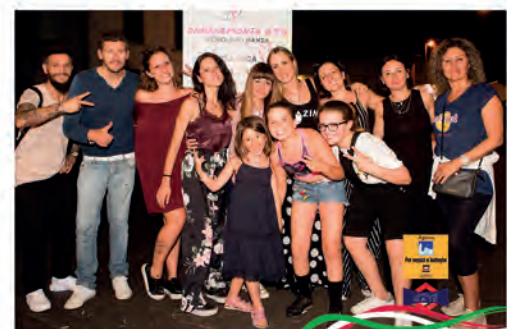
SOLO concorso città di Prato - FOTOGRAFI SPORTIVI